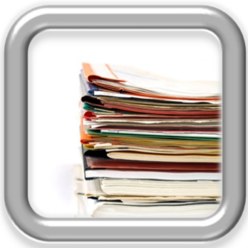
Collaborating with Educational Diagnosticians in the Referral and Evaluation Process