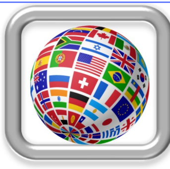
Working with Interpreters