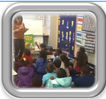
Breaking Into the Classroom: Service Delivery in the Schools